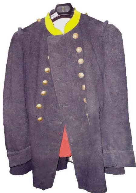
Tunique soldat 1867 et pantalon rouge (collection musée Militarial)